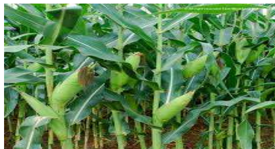
Gambar 1. Zea mays L